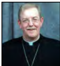
Monseigneur Dorylas Moreau, évêque de Rouyn-Noranda