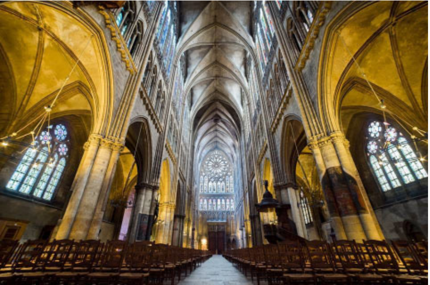
La cathédrale de Metz, en France.

Rien d'autre que ce que nous en ferons ...mais avec l'aide de l'Esprit Saint !