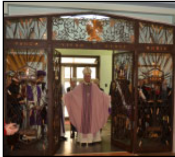
Mgr Moreau ouvre la Porte sainte à la cathédrale.

qui convient. Si on choisit d'y aller seul, on peut franchir la porte sainte dans l'heure qui précède la messe quotidienne, à 16 h 15.