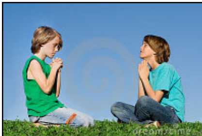
Que sera l'Église de demain? «Quand le Fils de l'homme reviendra, trouvera-t-il encore de la foi sur la terre?»

Pour ce faire, «il s'agit donc, au niveau des Églises diocésaines et des paroisses, de faire une évaluation missionnaire de toutes les structures et pratiques administratives pour voir si elles manifestent le coeur de