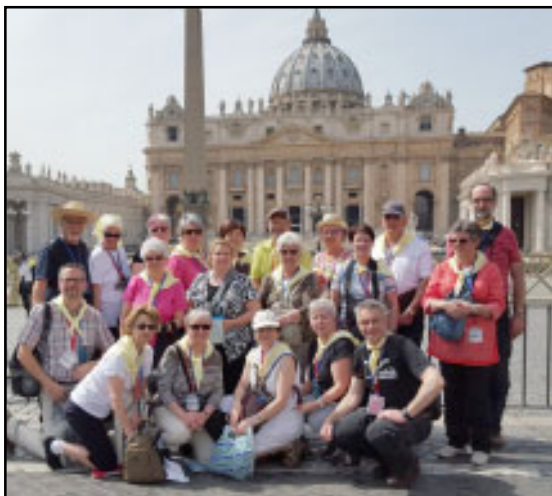
Les pèlerins à Rome.

Nous avons eu le privilège de nous recueillir et de célébrer l'eucharistie dans plusieurs hauts lieux spirituels tels qu'à la basilique Sainte-Marie-des-Anges à Assise, à la cathédrale de Florence, au sanctuaire national de Notre-Dame de Pompéi. Les pèlerins et pèlerines ont vécu de beaux moments de ressourcement. Voici quelques témoignages.