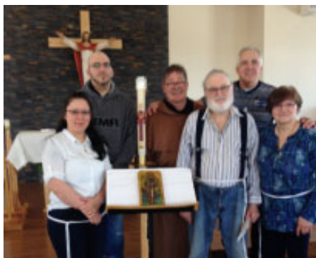
La jeune Fraternité est actuellement composée de six personnes.

célibataires, attirés par la spiritualité de saint François d'Assise et sa manière de vivre. Ces laïcs franciscains se rencontrent régulièrement pour partager la Parole de Dieu et se fortifier dans la prière et le