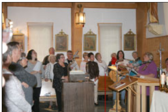
La chorale a mis tout son coeur.

Désormais, les catholiques de la paroisse de Destor seront rattachés à la paroisse St-Norbert de Mont-Brun.