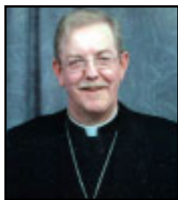
Monseigneur Dorylas Moreau, évêque de Rouyn-Noranda