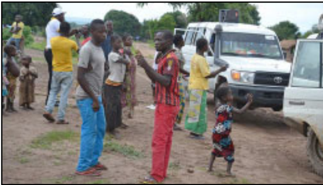
La pauvreté sévit partout au Congo

pour exiger de leurs gouvernements et les multinationales de faire la justice à la République Démocratique du Congo, malgré le silence quelque peu complice des médias.