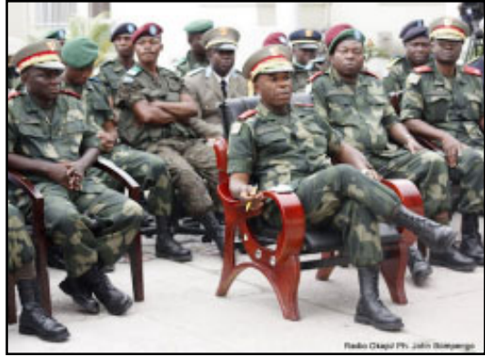
L'armée congolaise recrute des jeunes.

En plus, actuellement l'épidémie Ebola continue à faire des victimes, les